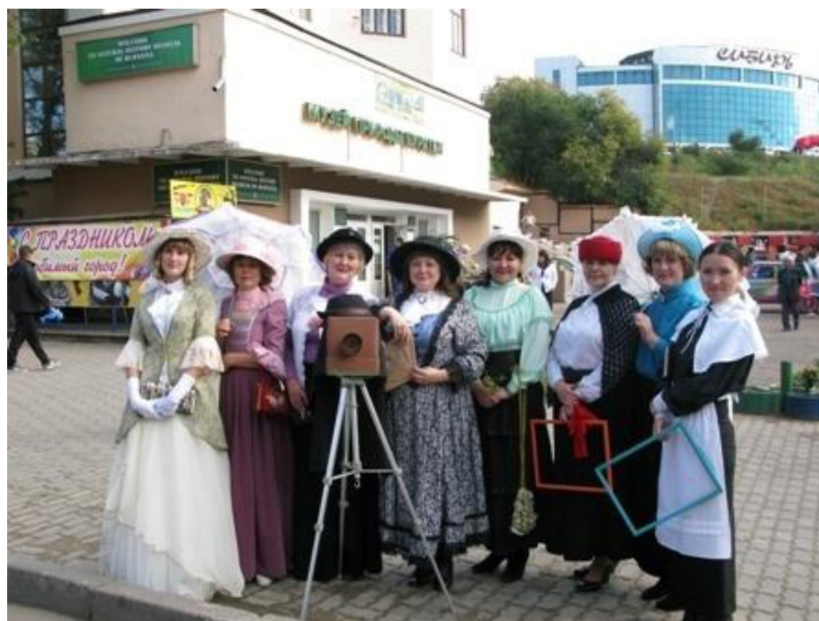
День города. «Городская интеллигенция» г. Верхнеудинска – как будто сошла со старых фотографий...