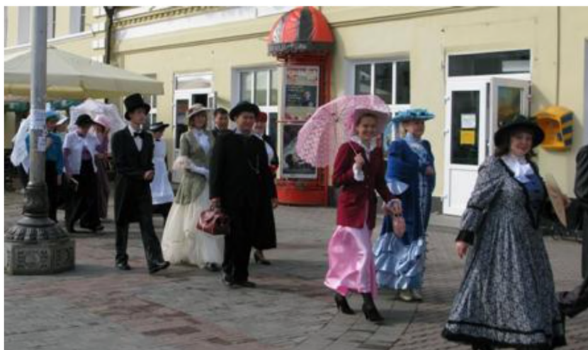
Шествие по Арбату