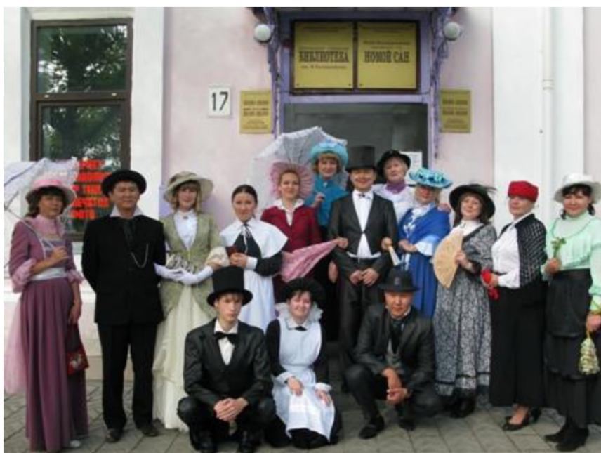
У стен родной библиотеки